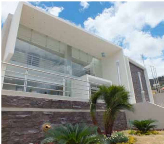
Unidad Judicial del Cantón Gualaceo.

sión de brindar una atención digna, cómoda y articulada administrativa y procesalmente, se hizo efectiva ya, en diciembre de 2009, cuando los juzgados de todas las