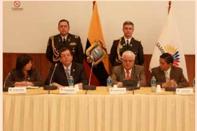
Corte Nacional de Justicia presenta Proyecto de Reforma al Código Orgánico de la Función Judicial.