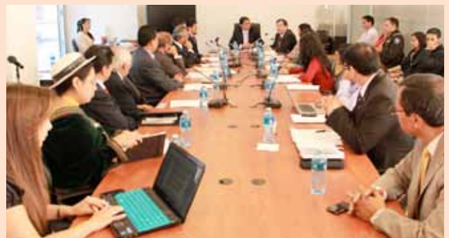
La Corte Nacional de Justicia en la Reforma al Código Orgánico de la Función Judicial y Código de Procedimiento Penal.