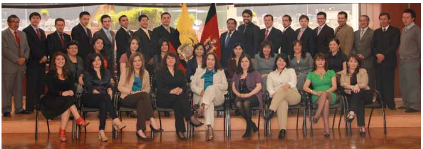
Pesonal que conforma la Sala Especializada de lo Penal de la Corte Nacional de Justicia.