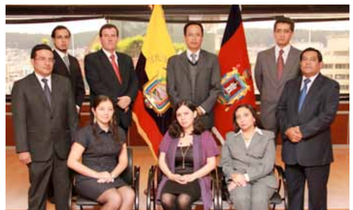
Personal que integra el equipo de trabajo de la Sala de lo Penal Militar, Penal Policial y Tránsito