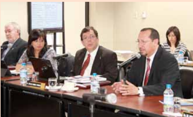
Análisis al proyecto de Código Orgánico General del Proceso con autoridades del Consejo de la Judicatura y Corte Nacional.