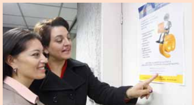
El área de Relaciones Públicas ha iniciado una campaña del correo institucional a las funcionarias y los funcionarios de la Corte Nacional de Justicia.