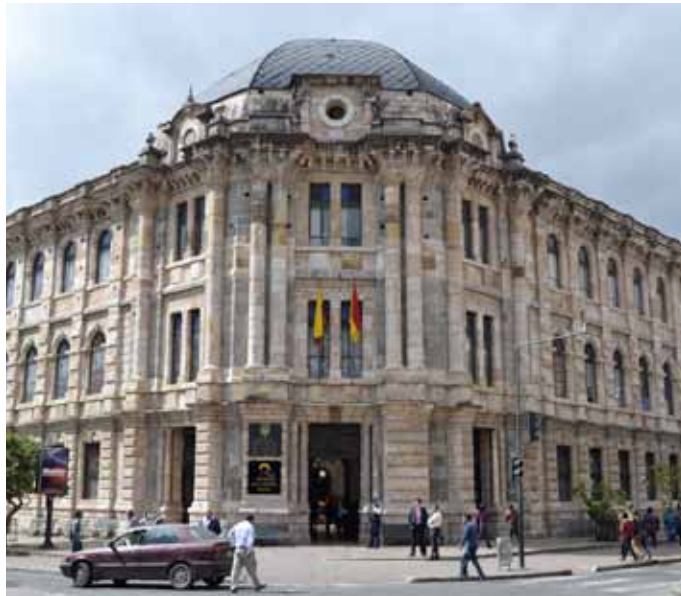
Corte de Justicia del Azuay.

El adelanto que ha tenido la Función Judicial en esta provincia frente a otros territorios es significativo. La vi-