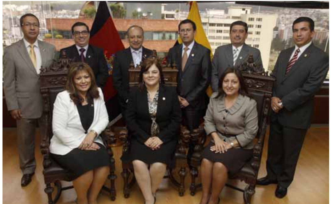
Juezas y Jueces que integran la Sala Especializada de lo Penal de la Corte Nacional de Justicia.

Por primera vez, en la historia de la más alta corte de justicia ordinaria, se desarrollan tres audiencias simultáneas, atendiendo hasta doce audiencias diarias, en horarios que incluyeron señalamientos fuera de las horas de la jornada de trabajo, para lo cual se contó con la decidida colaboración de todo el personal de la Sala Penal. Lo que permitió, en poco tiempo, el inmediato despacho de 1.078 causas; es decir, que en apenas ocho meses de incansable labor, han sido atendidas más del 42% del total de causas recibidas por la Sala. La competencia de esta Sala le faculta para conocer los recur-