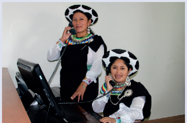
Actualmente la Institución cuenta con profesionales encargadas de operar el PBX de la Corte Nacional de Justicia.