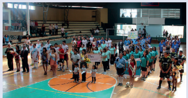
Toma de Juramento a equipos participantes en las Jornadas Deportivas de Integración CNJ 2013.