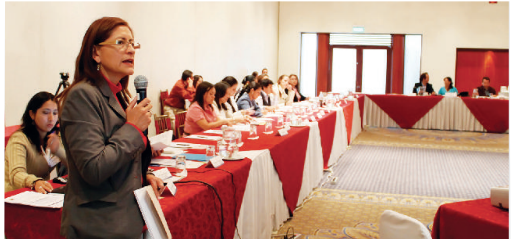
La Gerente del Programa de Prácticas Pre Profesionales expuso los detalles de esta iniciativa en Quito y Guayaquil.

el Consejo de la Judicatura lideró varias reuniones de coordinación en Quito y Guayaquil con autoridades del sector justicia, decanos de las Facultades de Derecho del país, representantes de las Asociaciones de Estudiantes y directores de los Consultorios Jurídicos Gratuitos.