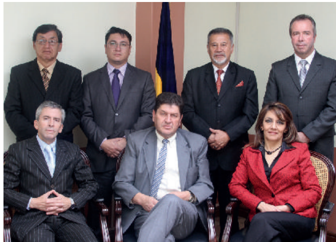
Presidente y Tribunal de la Corte Provincial de Justicia del Cañar