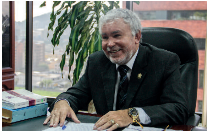
Dr. Eduardo Bermúdez Coronel, Presidente de la Sala de lo Civil y Mercantil de la Corte Nacional de Justicia

más de grado es principalmente de tipo cualitativo, de contenido y fuerza argumentativa. Ronald Dworkin encuentra que los principios hacen referencia a la justicia y a la equidad, mientras que las reglas se aplican o no se aplican, los principios dan razones para decidir en un sentido determinado, pero, a diferencia de aquellas, su enunciado no determina las condiciones de su aplicación (Los derechos en serio, 1995, p.198). En el evento de anomías y antinomías son aplicables los principios en cuanto dan respuesta adecuada al problema planteado a través de la integración del razonamiento en una teorización. Los principios, en cuanto mandatos de optimización, exigen una realización lo más completa posible y en relación con las posibilidades jurídicas y fácticas; estas últimas se logran a través de los principios de adecuación y necesidad, en tanto que, con relación a las primeras, requieren una ley de ponderación o balanceo, que Robert Alexy la formula así: "Cuanto más alto sea el grado de incumplimiento o de menoscabo de un principio, tanto mayor debe ser