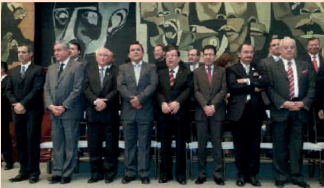
Autoridades asistentes a la ceremonia de posesión de Presidente y Vicepresidente de la República - 24 de mayo de 2013.