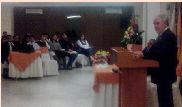
El presidente de la Sala de lo Civil y Mercantil de la CNJ, doctor Eduardo Bermúdez Coronel, en el Seminario Nacional "Recursos ordinarios y extraordinarios en los procesos judiciales".