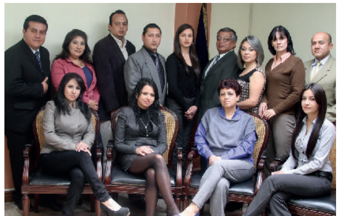
Personal de la Presidencia y Salas Especializadas Civil y Penal