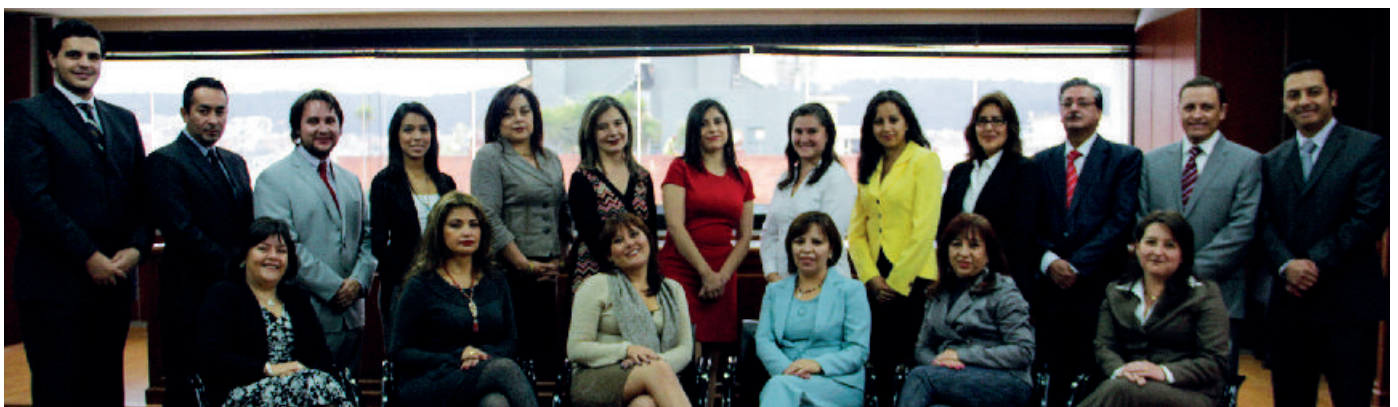
Personal que integra la Sala de lo Civil y Mercantil de la Corte Nacional de Justicia