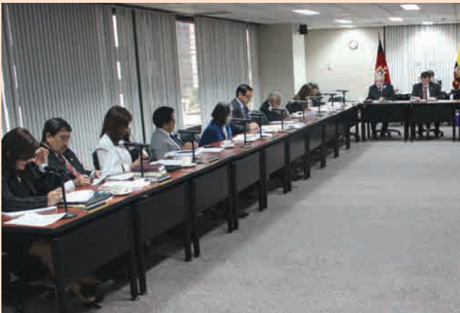
Juezas y Jueces de la Corte Nacional de Justicia en sesión del Pleno de la Institución.