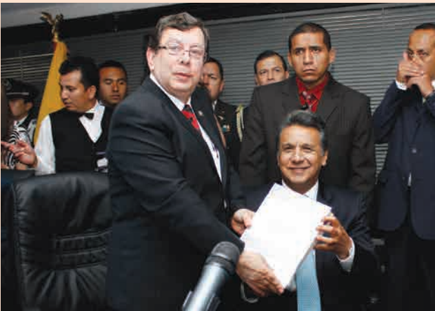
Entrega de Libro de Rendición de Cuentas de la CNJ por parte del Titular de la Institución al Presidente de la República Encargado.