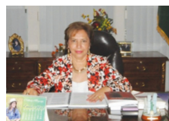
Corte de Justicia Los Ríos

El diseño de este complejo judicial se ajusta al nuevo Modelo de Gestión, y a los ejes estratégicos que está implementando el Consejo de la Judicatura de transición en todas las ciudades del país, para que la ciudadanía acceda a un mejor servicio de justicia, la edificación cuenta con accesos a ascensores para los servidores y servidoras judiciales, ciudadanía y personas con discapacidad.