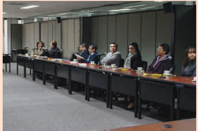
Conjuezas y Conjueces de la Institución en reunión de trabajo con Presidente, Juezas y Jueces Nacionales.