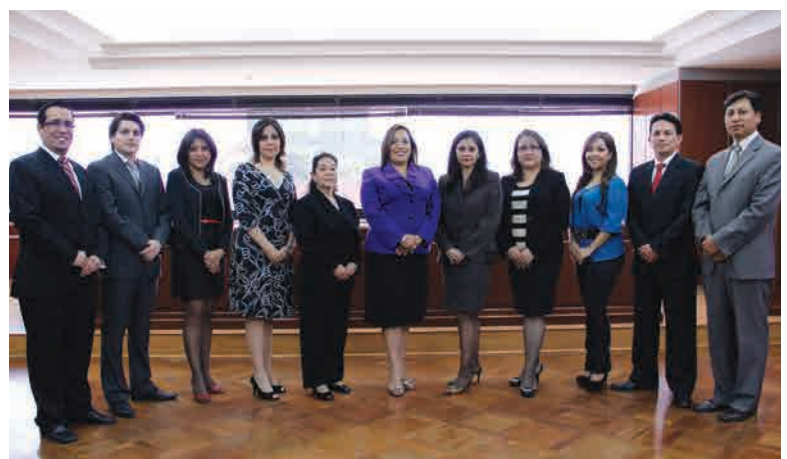
Personal que integra la Sala de Sala de lo Contencioso Administrativo de la Corte Nacional de Justicia.