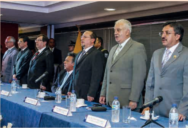
Rendición de Cuentas de la Corte Nacional de Justicia, 17 de enero de 2013. Mesa de Autoridades.