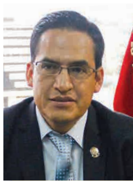
DR. JOSÉ SUING NAGUA Presidente de la Sala de lo Contencioso Administrativo de la Corte Nacional de Justicia

La Sala, en el año de gestión de la nueva Corte Nacional de Justicia, modificada en su composición interna por dos ocasiones, hecho que incidió en el normal despacho desde el inicio, ha logrado, al finalizar el primer año de funcionamiento de la Corte, avanzar de manera sostenida en el despacho, con el equipo de jueces/as que la integramos, especializados en la variada temática que se aborda en este escenario de la administración de justicia; para este segundo año, aspiramos superar sustancialmente los resultados alcanzados hasta ahora. La descongestión de las causas rezagadas permitirá mejorar en el despacho con