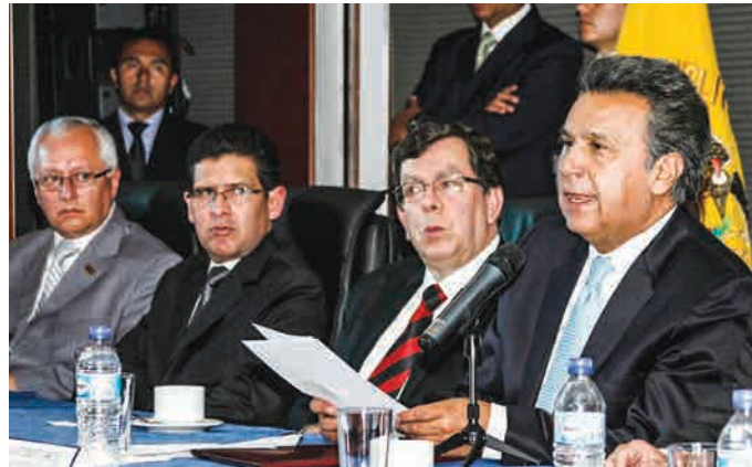
Rendición de Cuentas de la Corte Nacional de Justicia.

El Presidente de la Corte Nacional de Justicia, Doctor Carlos M. Ramírez Romero, realizó la Rendición de Cuentas en el mes de enero al cumplir un año de gestión. “Un cambio a la viejas prácticas de integración de Cortes, un cambio saludable para la democracia, para la independencia y para la seguridad jurídica”, fueron las palabras del titular de la Corte, enfatizando el proceso de transformación que la justicia del Ecuador ha sufrido, luego de que el pueblo ecuatoriano se pronunció por una restructuración de la función judicial, en el que nueve Juezas y doce Jueces de diferentes provincias del país, se posesionaron a través de un