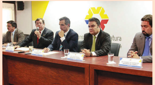
Rueda de Prensa con los Representantes de las Instituciones del Sector Justicia.