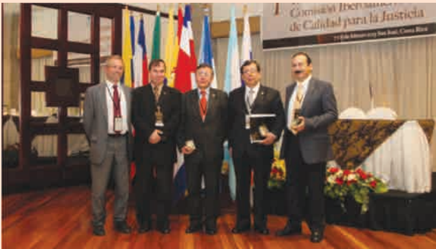
Primera Reunión Comisión Iberoamericana de Calidad para la Justicia - Costa Rica