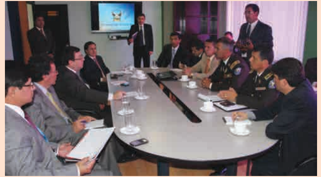
Autoridades de la CNJ en reunión de cooperación interinstitucional con la Dirección Nacional de Antinarcoóticos.