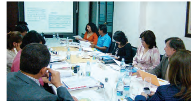
Sesión Consejo Nacional de la Niñez y Adolescencia Oct. 2012

La Justicia es para las personas como para las sociedades un derecho fundamental para lograr el bien estar y el buen vivir. Para lograr su pleno ejercicio se requiere articulación y coordinación interinstitucional. El Consejo Nacional de la Niñez y Adolescencia ha coordinado para mantener y desarrollar la justicia especializada, eficiente y eficaz para aplicar las sanciones pertinentes que buscan la reflexión y reinserción de adolescentes en conflicto con la ley, en la vida familiar y comunitaria, a fin de que el proyecto de vida de estas personas no se vea afectado o anulado por actos que responden a un contexto social y económico y en muchas oportunidades a la manipulación de personas adultas para usar a adolescentes, e incluso niñas o niños, como ejecutores de actos delictivos. El abuso sexual es un tema en el que el trabajo interinstitucional se hace indispensable