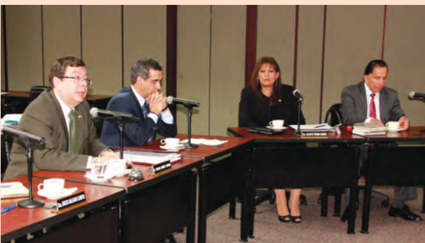
Presentación al Pleno de la Corte Nacional de la Justicia de la terna para integrar el nuevo Consejo de la Judicatura.