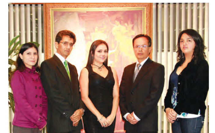
Personal que integra el equipo de trabajo de la Sala de Adolescentes Infractores.