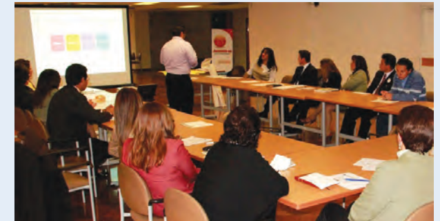
Taller "Manejo del Cambio" impartido a funcionarios de la Corte Nacional de Justicia.