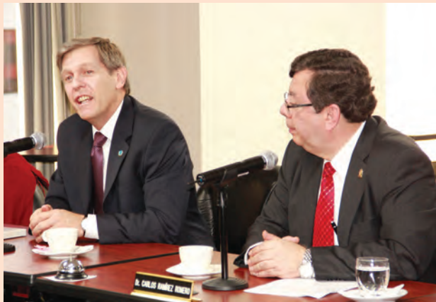
Conversatorio en el Pleno de la CNJ sobre "Derechos Colectivos e Indígenas"