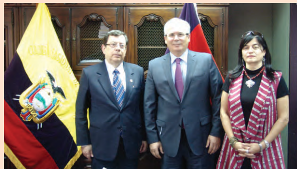
Presidente del CNJ Dr. Carlos Ramírez junto a Veedores Internacionales.

La Constitución, norma jurídica fundante del Estado, es el eje con potestad en todo el ordenamiento jurídico, no sólo en la relación entre ciudadanos y estado sino en las relaciones que establecen los ciudadanos entre sí. En este sentido, la Constitución, sus preceptos, valores y principios, son de derecho público y su contenido condensa en esencia mínimos que no quedan al arbitrio de las relaciones privadas, a riesgo de volverse inconstitucionales.