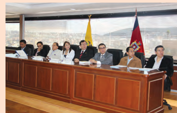
Mesa de Expositores, Representantes de Cortes Provinciales junto a Ponentes y Presidente de la CNJ.