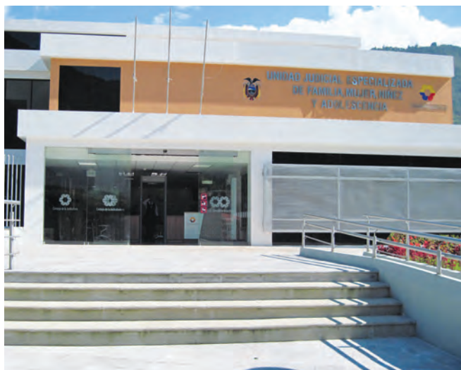
Unidad Judicial Especializada de Familia, Mujer, Niñez y Adolescencia de Baños.

plementado la Unidad de Contravenciones, La Unidad Judicial Multicompetente Primera Civil en el Cantón Baños, la Unidad Judicial Especializada Primera de la Fa-