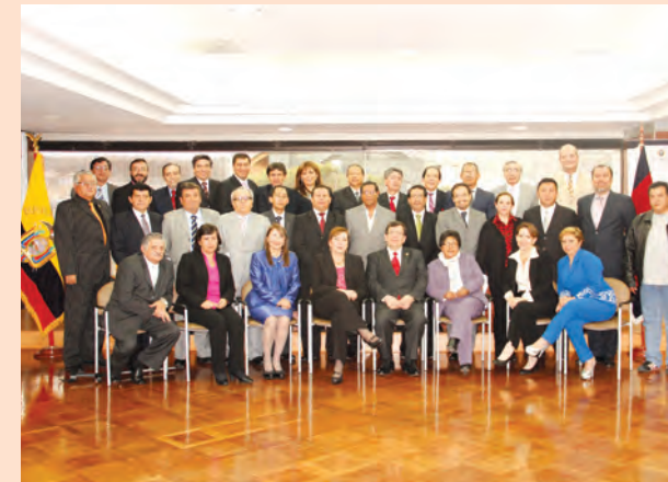
Primer Encuentro Nacional de Presidentes de Cortes Provinciales 14 y 15 de diciembre de 2012.