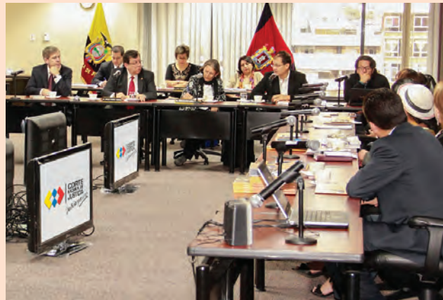
Participación de autoridades de la CNJ en Conversatorio de "Derechos Colectivos e Indígenas".