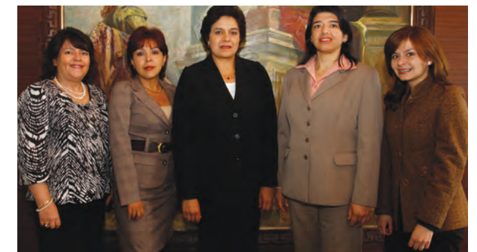
Personal que integra la Sala de la Familia, Niñez y Adolescencia.