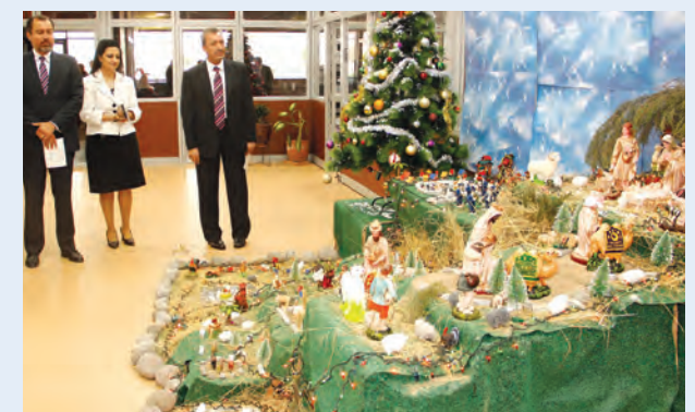
Espíritu Navideño Concurso de pesebres organizado por el área de Relaciones Públicas.