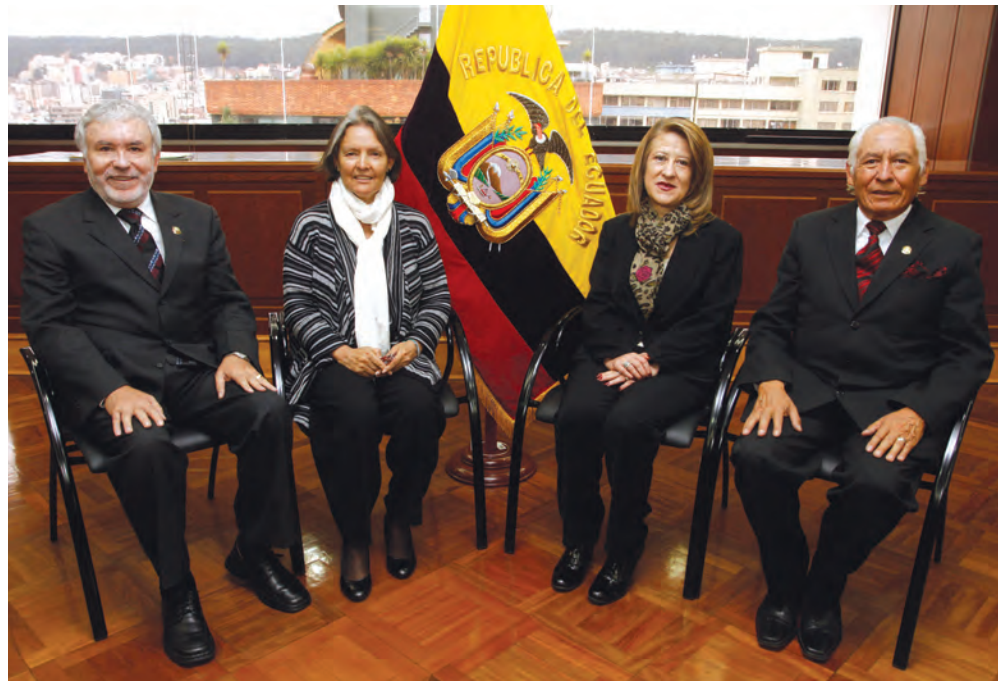
Juezas y Jueces que integran la Sala de la Familia, Niñez y Adolescencia de la Corte Nacional de Justicia.

El Art. 183 del Código Orgánico de la Función Judicial, acatando la disposición constitucional prevista en el Art. 182 que consagra la organización de la Corte Nacional de Justicia en Salas Especializadas y en sintonía con el principio de especialidad de la justicia, contempla por primera vez en la historia la conformación de tan elevado órgano de administración de la justicia ordinaria considerando una Sala dedicada al conocimiento y resolución de los recursos de casación deducidos en las causas promovidas por cuestiones que atañen a las relaciones de familia, niñez y adolescencia, estado civil de las personas, filiación, matrimonio, unión de hecho, tutelas y curadurías, adopciones y problemas derivados de la sucesión por causa de muerte. Materias éstas que hasta la fecha de entrada en vigencia total del Código inicialmente citado, venían siendo atendidas por los jueces civiles, que en su mayoría habían orientado su actividad especialmente al conocimiento y resolución de los asuntos patrimoniales, sin que se les haya dado la importancia que su trascendencia exige, pues se refieren a los problemas de las y los seres humanos, en cuanto titulares de derechos y obligaciones, más que meramente patrimoniales, ya que implican la posibilidad de permitirle