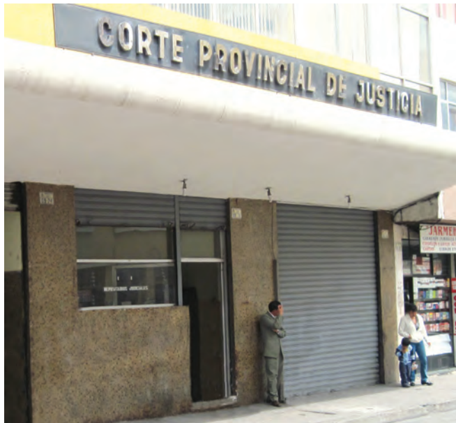
Corte de Justicia de Tungurahua