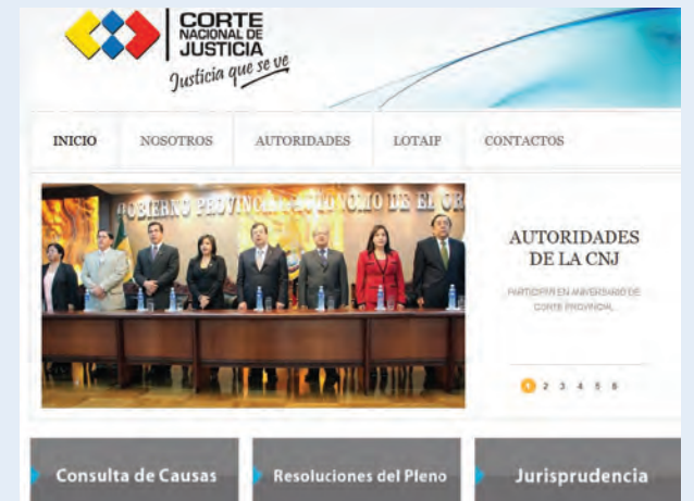
Ahora los funcionarios y ciudadanos pueden navegar en la Nueva página web de la Corte Nacional de Justicia.