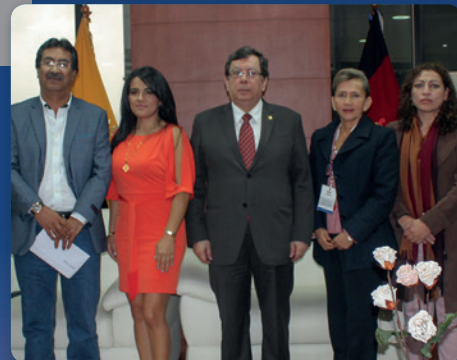
Posesión de delegados para las elecciones del FONCEJU. 15/3/2017.