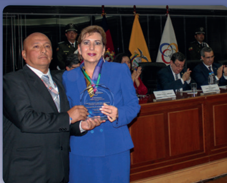
Acto de reconocimiento a Jueces mejor evaluados a nivel nacional. 21/3/2017.