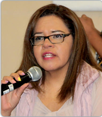
Msc. Consuelo Bowen Mansur Presidenta del Consejo Nacional para la Igualdad de Género (CNIG)