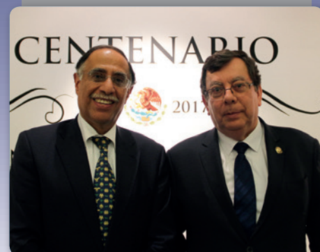
Exposición: Genealogía jurídica de la Constitución Política de los Estados Unidos Mexicanos . 6/2/2017.