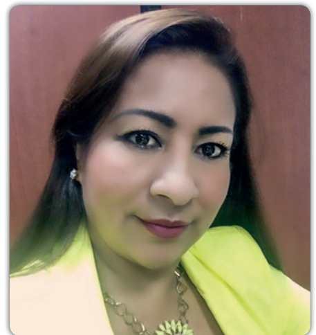
Dra. Jenny Elizabeth Córdova Paladines Presidenta de la Corte Provincial de Justicia de El Oro

Como presidenta de la Corte Provincial de Justicia de El Oro, muy orgullosa del avance logrado por las mujeres, esto es, acercarnos cada vez más a la meta de transformación de la sociedad con justicia, libertad, no discriminación, equidad de género y sobre todo que se pueda visibilizar a la mujer en la gestión pública en cargos de poder, en igual de condiciones, con los mismos derechos y oportunidades y que las medidas de acción afirmativa algún momento lleguen a ser solo un recuerdo histórico en la conquista de la igualdad de hombres y mujeres.