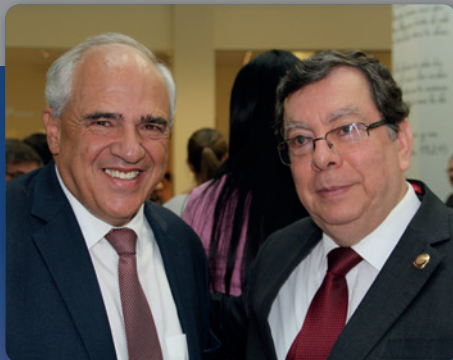
Presentación del Informe Final de Gestión, Secretario General Ernesto Samper Pizano. 31/1/2017.