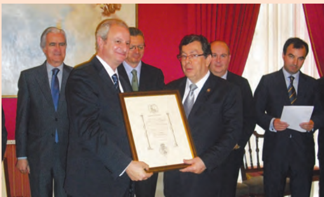
Presidente de la Corte Nacional de Justicia, en Bicentenario de la Constitución de 1812 del Reino de España; Madrid y Cádiz, del 17 al 21 de junio de 2012.