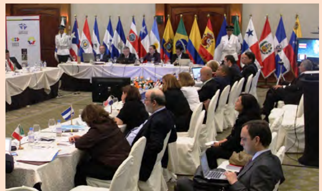
Delegaciones Asistentes. Cumbre Judicial Iberoamericana, del 28 de febrero al 3 de marzo de 2012.