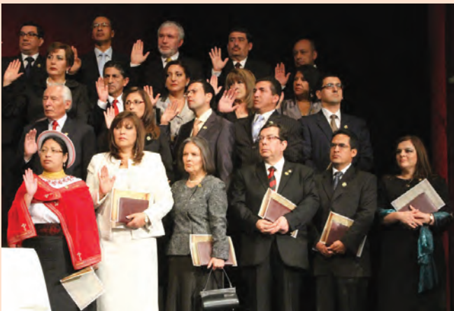
Posesión de Juezas y Jueces Nacionales. Teatro Nacional Sucre, 26 de enero de 2012.