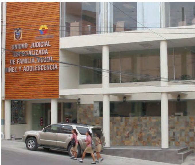
Unidad Judicial de Familia, Mujer, Niñez y Adolescencia. Macará, Loja. Inauguración: 27 de junio de 2012.