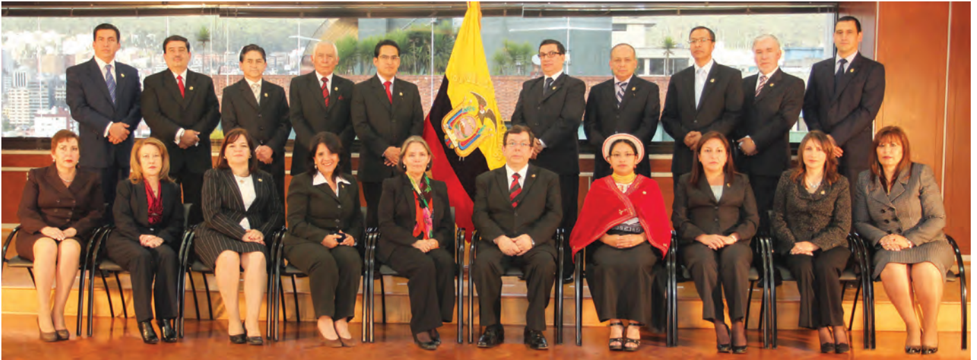
Juezas y Jueces que integran el Pleno de la Corte Nacional de Justicia de la República del Ecuador.