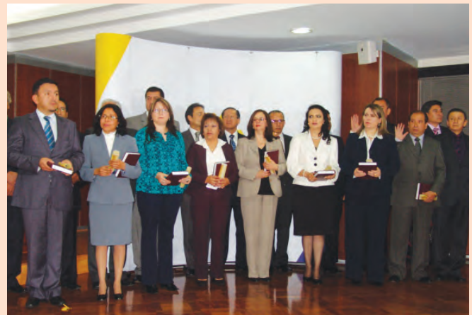
Posesión de Conjuezas y Conjueces de la CNJ. Auditorio de la Corte Nacional de Justicia, 2 de marzo de 2012.