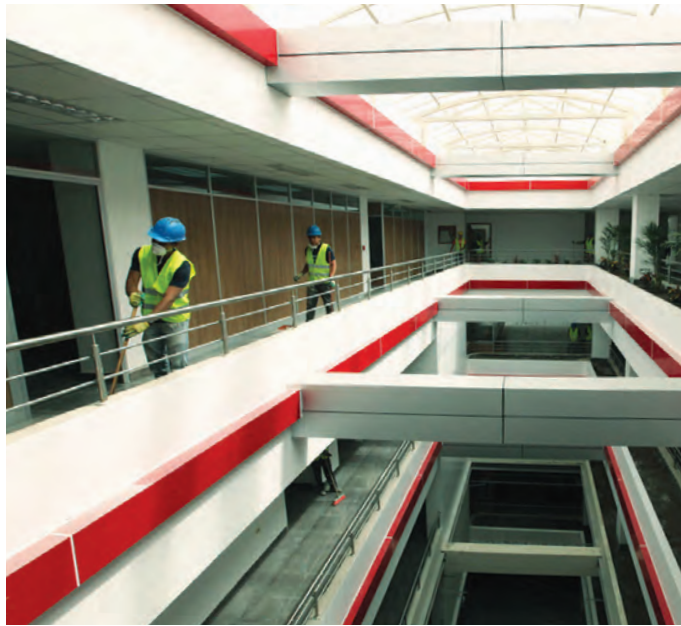
Remodelación del edificio de la Corte Provincial de Loja.

Desde junio funcionan con resultados positivos las Unidades Judiciales de Familia,