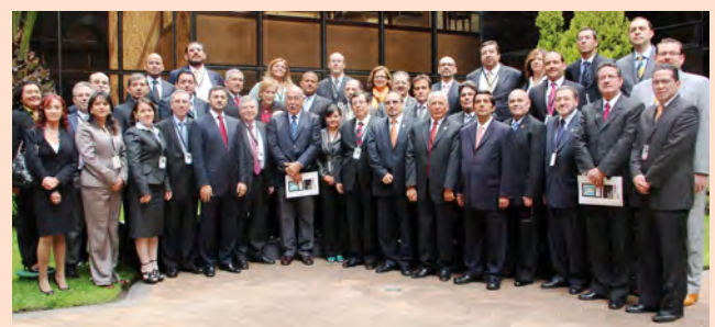
III Ronda Preparatoria para la XVI Cumbre Judicial Iberoamericana Quito-Ecuador.