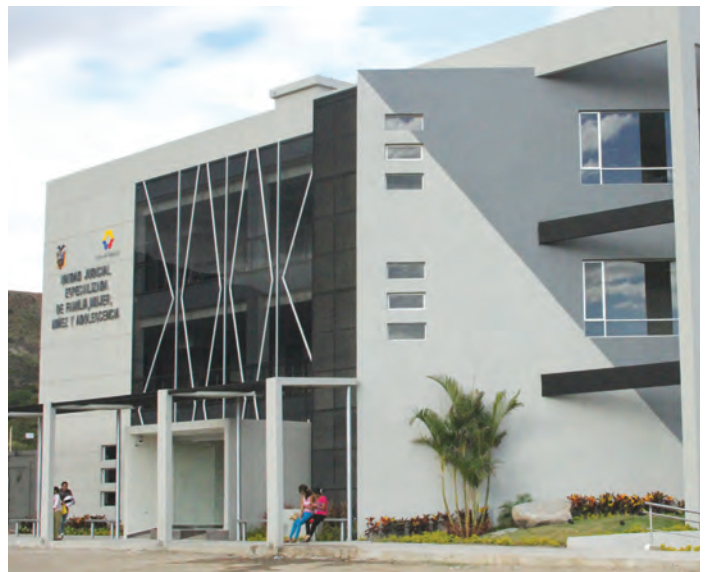
Unidad Judicial de Familia, Mujer, Niñez y Adolescencia. Catamayo, Loja. Inauguración: 27 de junio de 2012.