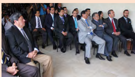
Posesión de Jueces Temporales. Salas Temporales, 2 de julio de 2012.