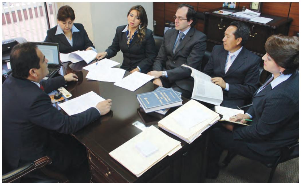
Grupo de trabajo del Departamento de Jurisprudencia e Investigaciones Jurídicas.

Corte Nacional de Justicia, en el link del Departamento de Jurisprudencia e Investigaciones Jurídicas, se encuentra el acceso a nuestro sistema SIPJUR, en donde se puede revisar toda la jurisprudencia procesada. Para terminar es preciso señalar que es preocupación permanente del Poder Judicial mejorar el servicio de justicia de nuestro país y lograr un funcionamiento más eficiente, que salvaguarde la calidad de la jurisprudencia y se promueva la predictibilidad de las decisiones judiciales y lograr con ello una mayor seguridad jurídica en el ámbito del sistema de justicia. Éstos son algunos temas que están en nuestra agenda, y sólo queda decir que con trabajo y voluntad es posible cumplir y superar nuestras propias metas. Ése es el compromiso de la Función Judicial.